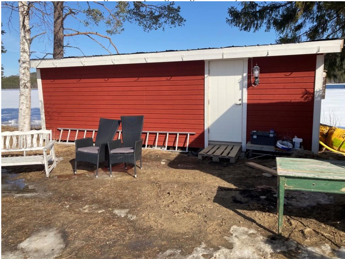
Figur 2, Vy från platsen, på fasadsida där tillbyggnad skall placeras.