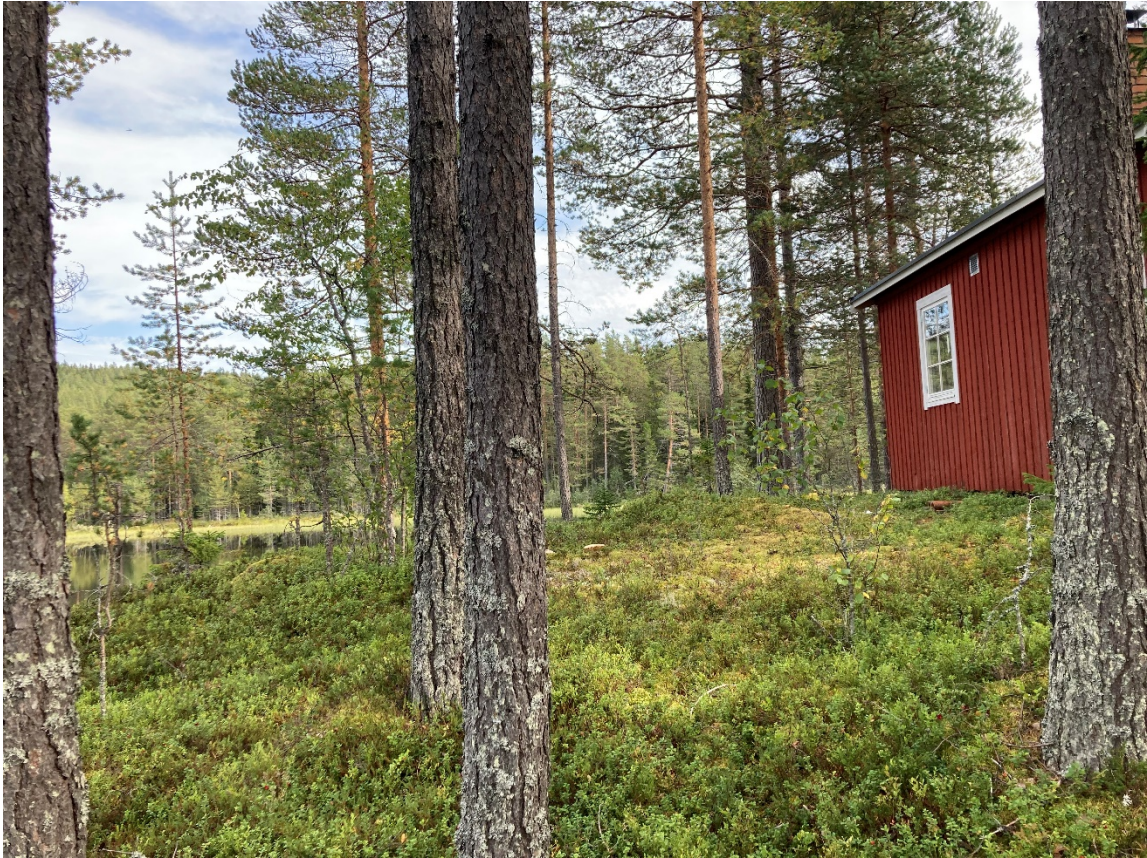
Figur 3, Plats för bastubyggnad, till höger i bild syns befintligt fritidsbus.