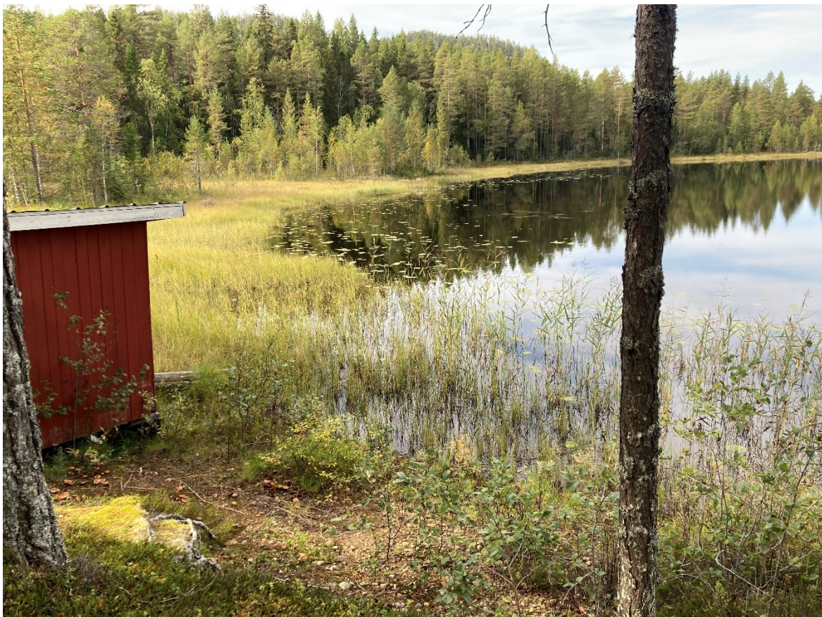
Figur 2, Plats för brygga, till vänster i bild syns befintligt båthus.