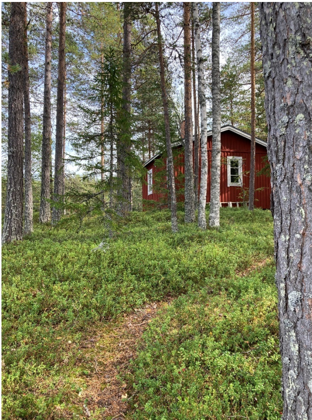
Figur 4, Vy från båtbus – upp mot fritidsbus.