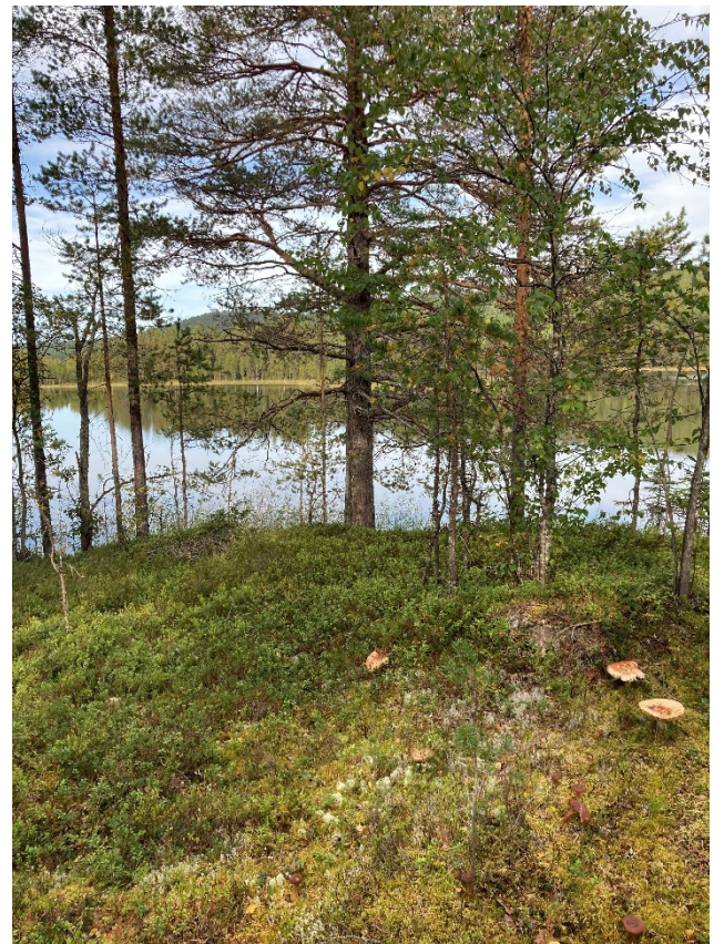
Figur 5, Vy från fritidsbus – mot tänket bastu.