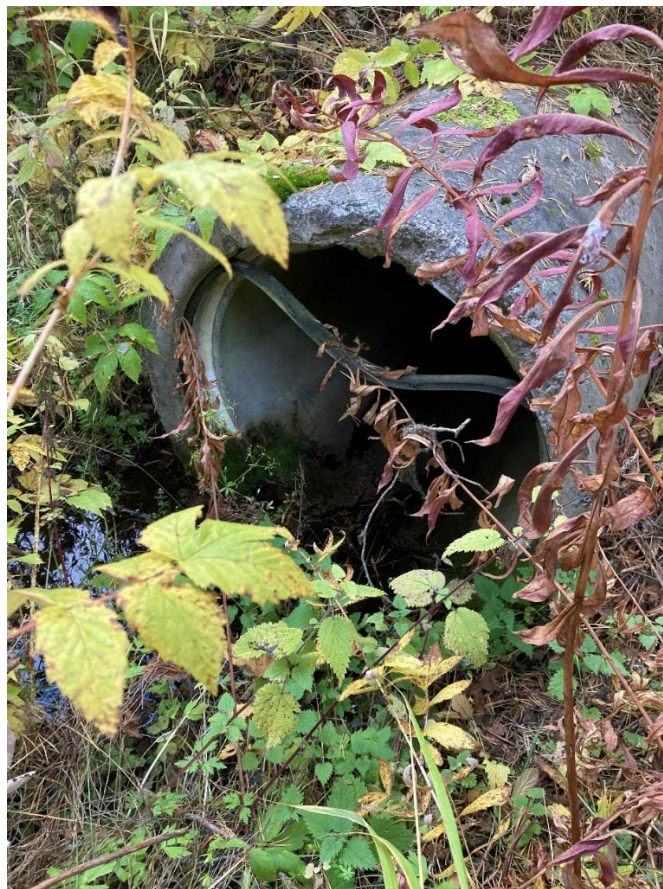
Figur 2, Trumman som skall bytas.