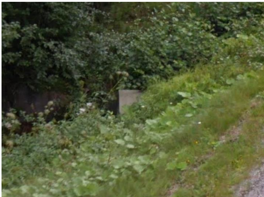
Figur 2, Trumman som skall bytas.