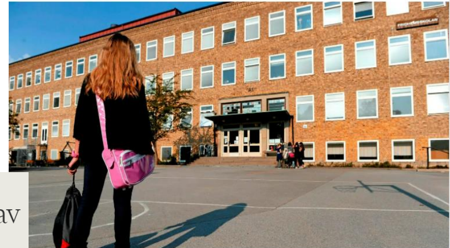
I dag finns skolan kvar – men hur länge till?

Uppdaterad i går 08:26 Publicerad i går 05:39