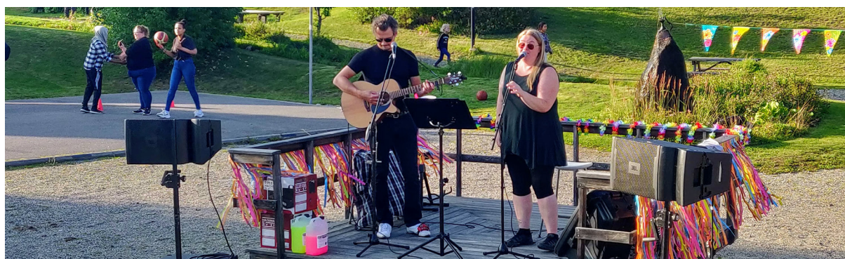
I augusti var det Trivselskväll i Bispgården med musikunderhållning av Coldshine.