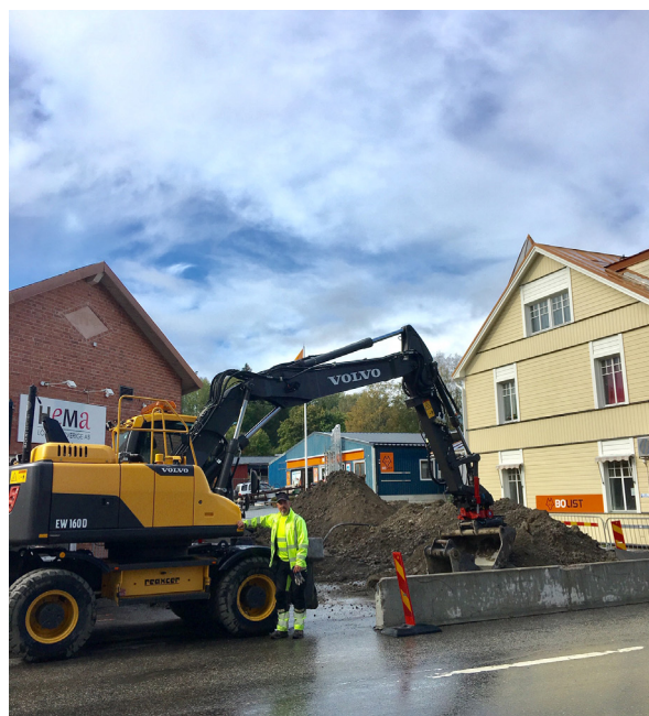
Ombyggnad av Centralgatan i Hammarstrand har påbörjats.

Diskussion pågår också om att införa 40 km/h som hastighetsbegränsning inom tätbebyggt område i Ragunda.