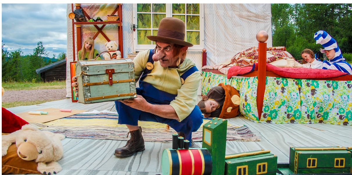
Dunderklumpen spelades för andra året i rad i Döda Fallet.

Vi behöver hitta arbetsformer för att öka det förebyggande arbetet för att minska elevernas stress och upplevelse av psykisk ohälsa i skolorna samtidigt som alla skolor behöver arbeta med ordningsregler och ledarskap i klassrummet.