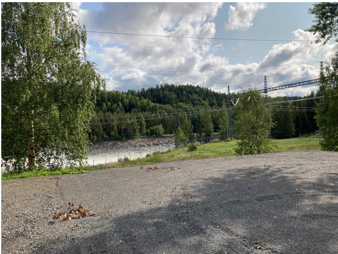
Figur 2, Plats för byggbaracker.