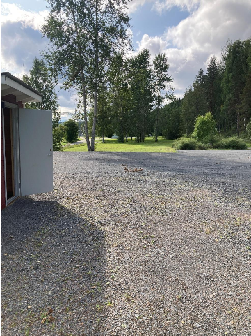
Figur 3, Vy från platsen, norr om tänkt etablering.